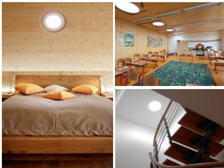
Puits de Lumière – Lumière naturelle sans fenêtre

Vous voulez plus de lumière chez vous sans installer de lampes et sans construire de fenêtre ?